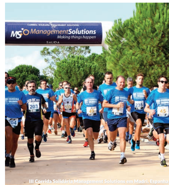
III Corrida Solidária Management Solutions em Madri, Espanha