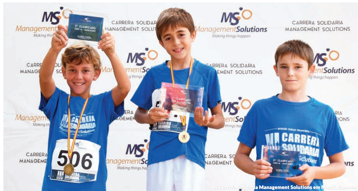
III Corrida Solidária Management Solutions em Madri, Espanha

Mais de 500 profissionais da Management Solutions tiveram novamente a oportunidade de levar esperança aos mais desfavorecidos através do projeto Natais Solidários, que foi organizado pelo undécimo ano consecutivo através da