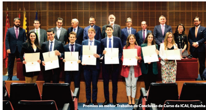
Prêmios ao melhor Trabalho de Conclusão de Curso da ICAI, Espanha