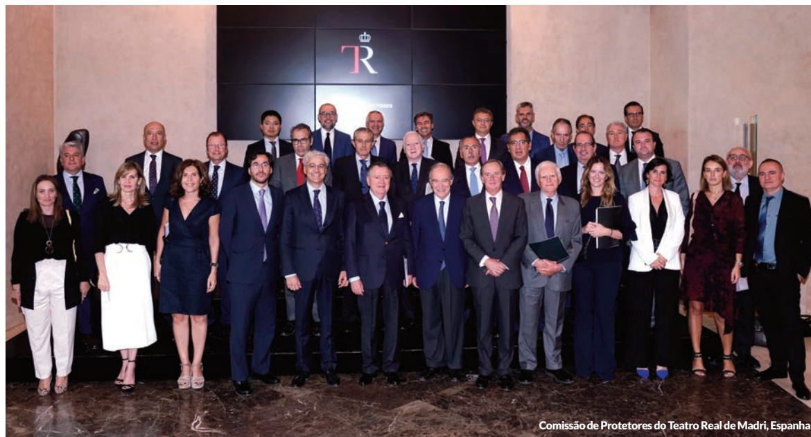
Comissão de Protetores do Teatro Real de Madri, Espanha

A Firma mantém uma política ativa de patrocínio e mecenato