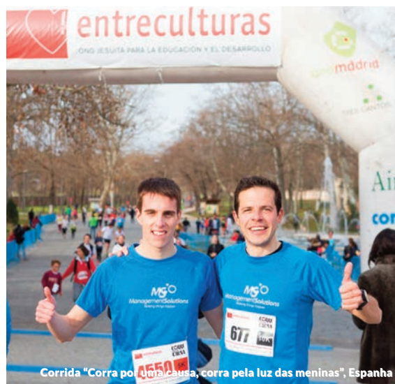
Corrida "Corra por uma causa, corra pela luz das meninas", Espanha

Da corrida, organizada pela fundação Entreculturas (ONG jesuíta sem fins lucrativos que está focada na educação como ferramenta para o desenvolvimento, transformação e diálogo