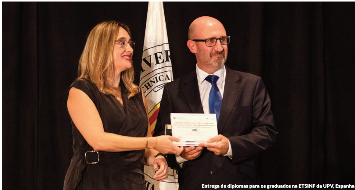
Entrega de diplomas para os graduados na ETSINF da UPV, Espanha

A Management Solutions organizou um business case na Universidade das Américas Puebla (UDLAP) onde se expuseram as metodologias matemáticas básicas para utilização de um modelo de machine learning (parte funcional) e sua aplicação em software comercial, bem como se uso nos modelos de captação de produtos nos bancos e auxílio na prevenção de cobranças não reconhecidas (parte técnica).