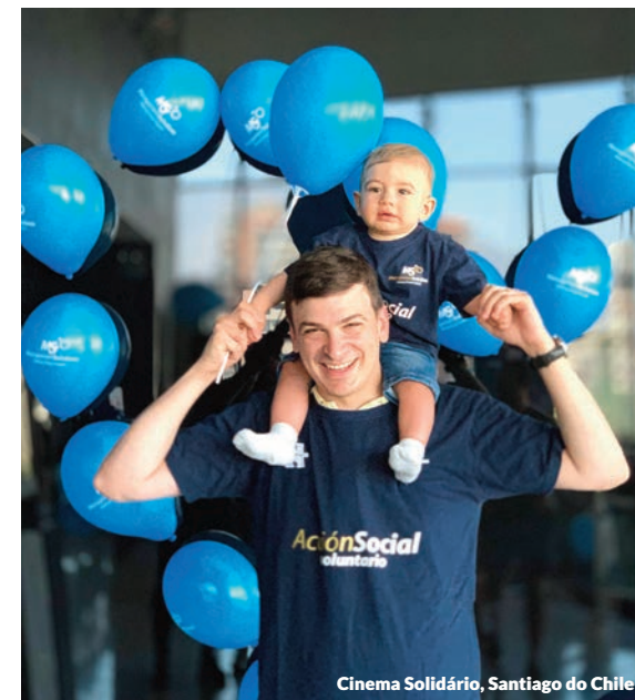
Cinema Solidário, Santiago do Chile