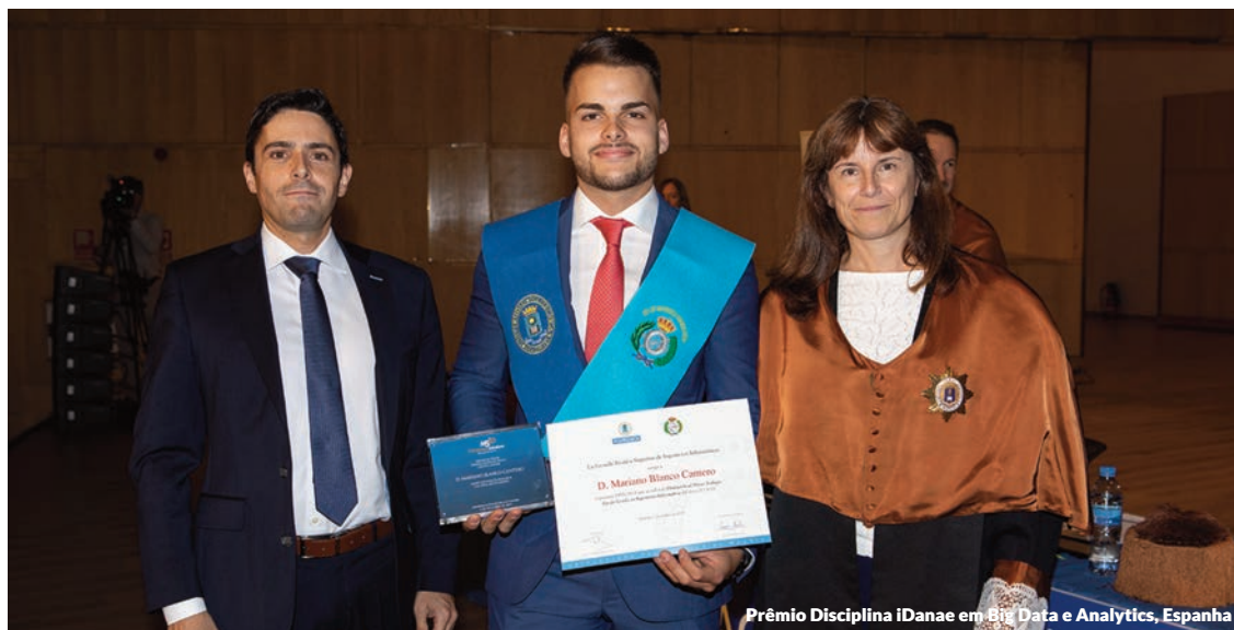
Prêmio Disciplina iDanae em Big Data e Analytics, Espanha

Esses prêmios foram concedidos após um processo de seleção entre os alunos com opção à matrícula de honra, cujos trabalhos foram avaliados com critérios que consideram a tecnologia e inovação do trabalho, a aplicação no mundo corporativo, bem como a capacidade de exposição de seus autores na apresentação a um júri avaliador.