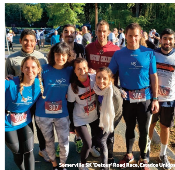
Somerville 5K "Detour" Road Race, Estados Unidos

Sob o lema "Teus quilômetros = sua inclusão", cerca de 5.000 pessoas participaram da prova realizada no Parque Juan Carlos I de Madri, disputado por três distâncias (10, 5 e 2,5 quilômetros). No final da corrida, a Management Solutions, juntamente com os demais patrocinadores, recebeu um reconhecimento por parte da Down Madri por sua colaboração neste evento.