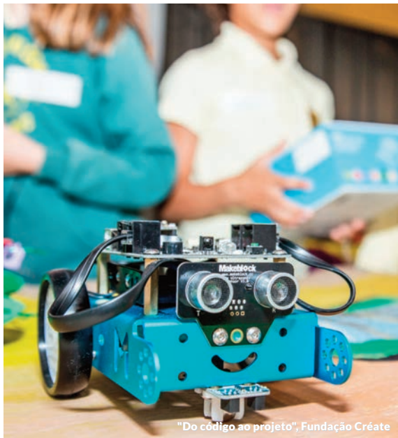
"Do código ao projeto", Fundação Créate

A Management Solutions assinou diversos convênios de colaboração com diversas fundações e instituições que promovem causas solidárias, de empreendedorismo ou integração social