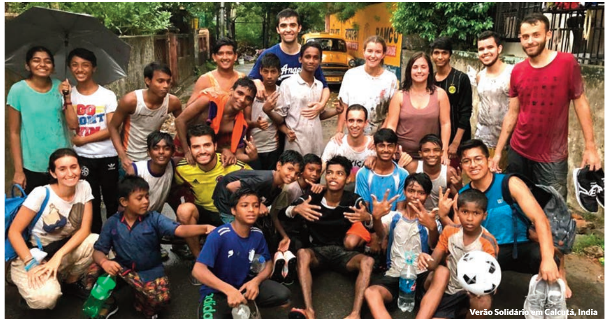
Verão Solidário em Calcutá, Índia

Entre 2012 e 2017 o Verão Solidário consistiu em colaborar com o programa de “Voluntários no terreno” fomentado pela ONG Ayuda en Acción. Assim, em 2012 e 2013, os profissionais da Firma viajaram a La Teresa dos Andes da Bolívia, um centro com o qual colabora a ONG espanhola e que atende cerca de 200 crianças com deficiência intelectual de diversos graus, entre 2014 e 2016 o voluntariado foi realizado em Santo Domingo de los Tsáchilas, no Equador; enquanto, em 2017, a atividade foi desenvolvida em Waslala (Nicarágua), em conjunto com a Fundação Madre Tierra (FUMAT), com o objetivo de reduzir a pobreza dos lares rurais.