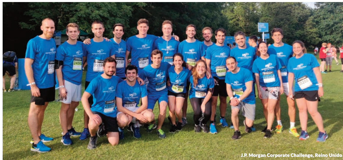
J.P. Morgan Corporate Challenge, Reino Unido

A prova realizada em Frankfurt também serviu para beneficiar e conscientizar sobre as fundações esportivas "German Sport Aid" e "German Disabled Sports Youth"; enquanto que na edição inglesa os recursos arrecadados foram destinados à Alzheimer Society, a principal instituição de caridade do Reino Unido para apoiar as pessoas com Alzheimer.