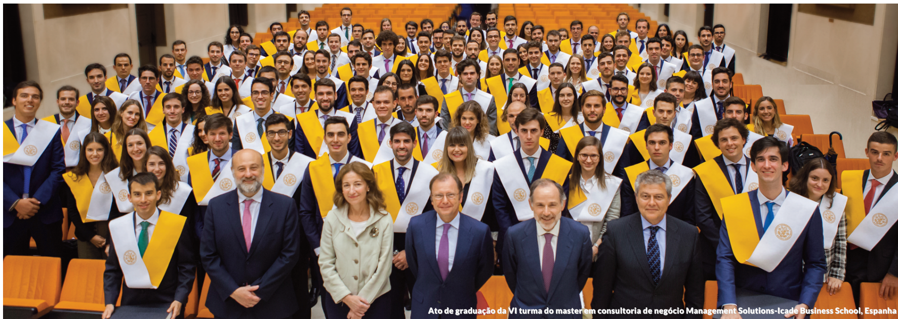
Ato de graduação da VI turma do master em consultoria de negócio Management Solutions-Icade Business School, Espanha

A Management Solutions contribui para a transmissão do conhecimento Universidade – Firma, por meio de convênios com as universidades mais prestigiadas do mundo,