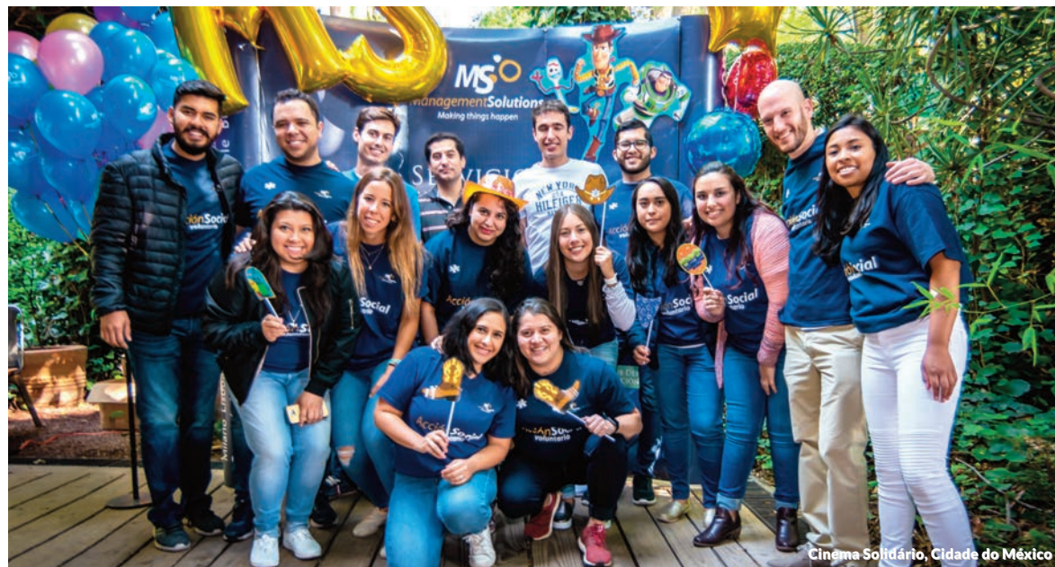
Cinema Solidário, Cidade do México

As crianças foram os verdadeiros protagonistas do dia e as que mais aproveitaram o filme, dos vídeos projetados e dos espetáculos infantis de animação oferecidos pelos atores, tanto na chegada como durante o almoço depois do filme. Os voluntários da Ação Social foram os responsáveis por essas atividades, cuidando da logística do dia e da entrega de tudo o que foi coletado às instituições mencionadas.