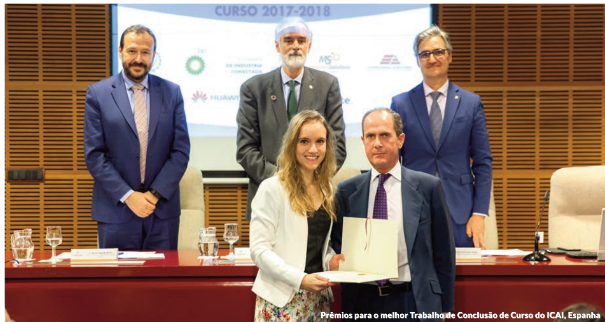
Prêmios para o melhor Trabalho de Conclusão de Curso do ICAI, Espanha