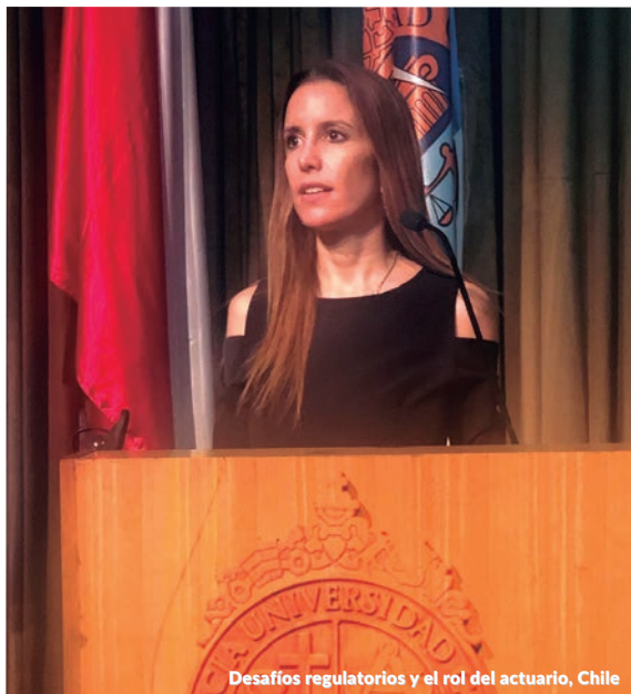
Desafíos regulatorios y el rol del actuario, Chile

La ponencia de Management Solutions llevó por título " Basel III Finalisation & Basel IV Impacts " y realizó un repaso por los principales cambios regulatorios y el impacto estimado en la industria europea.