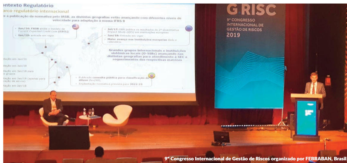
9º Congresso Internacional de Gestão de Riscos organizado por FEBRABAN, Brasil

impartidas a la Asociación de Bancos e Instituciones Financieras de Chile (ABIF). Ante la próxima publicación de la ley que regulará la implantación de Basilea III en el mercado chileno, Management Solutions tuvo la oportunidad de presentar su experiencia sobre la aplicación de la norma en Europa a representantes de las principales entidades financieras chilenas.