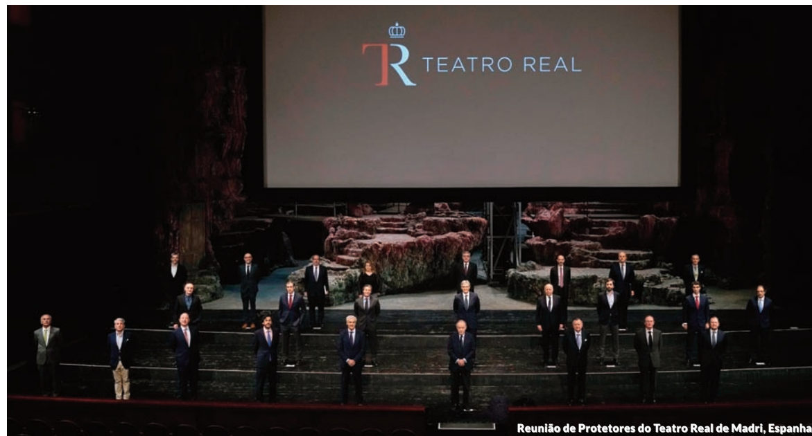
Reunião de Protetores do Teatro Real de Madri, Espanha

A Management Solutions participa como sócia no Clube Espanhol da Energia (ENERCLUB), constituído como ponto de