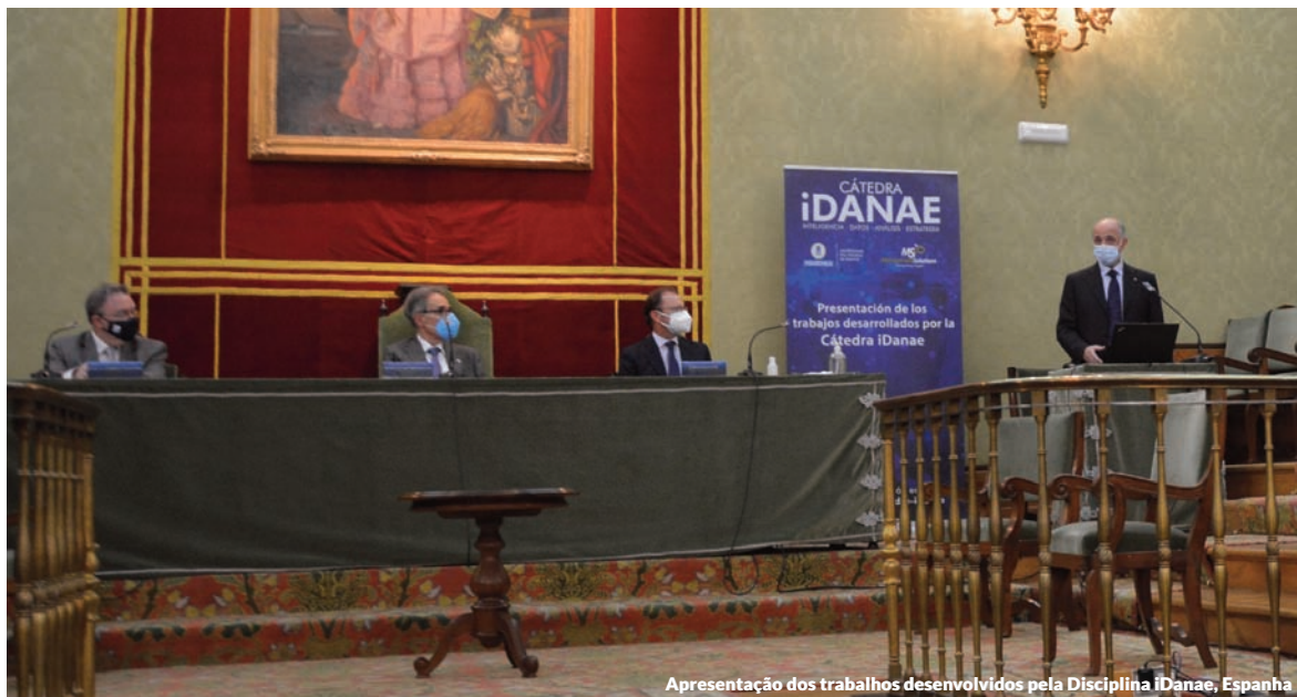
Apresentação dos trabalhos desenvolvidos pela Disciplina iDanae, Espanha

A publicação correspondente ao 3T20, intitulada "MLOps, uma peça chave no ecossistema digital", aborda a evolução do ecossistema de Data Science e o conceito e relevância das Operações de Machine Learning , ou MLOps, um conjunto de