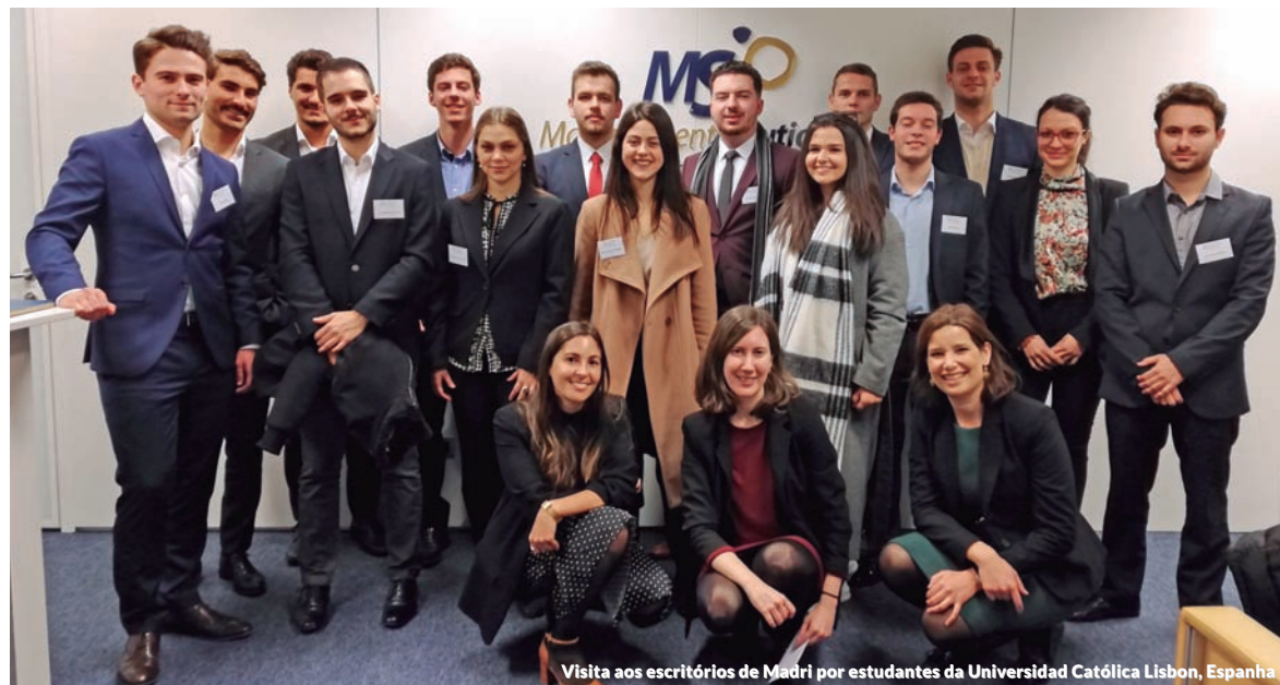
Visita aos escritórios de Madrid por estudantes da Universidad Católica Lisbon, Espanha