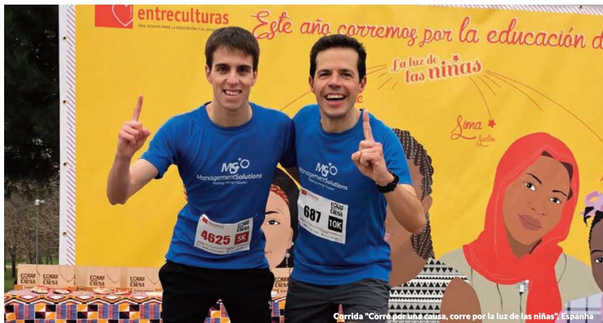
Corrida "Corre por una causa, corre por la luz de las niñas", Espanha

A Management Solutions México se une à iniciativa #UmDiaSemMulheres, que visa tornar visível a contribuição das mulheres em todas as áreas da sociedade e exigir um México mais justo, igual e livre de violência.