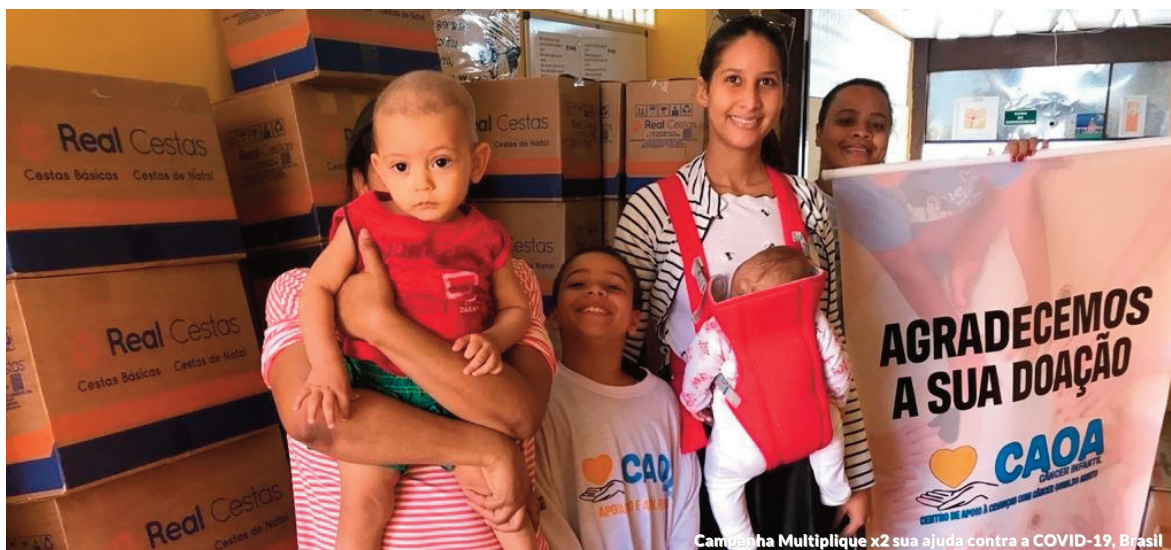
Campanha Multiplique x2 sua ajuda contra a COVID-19, Brasil