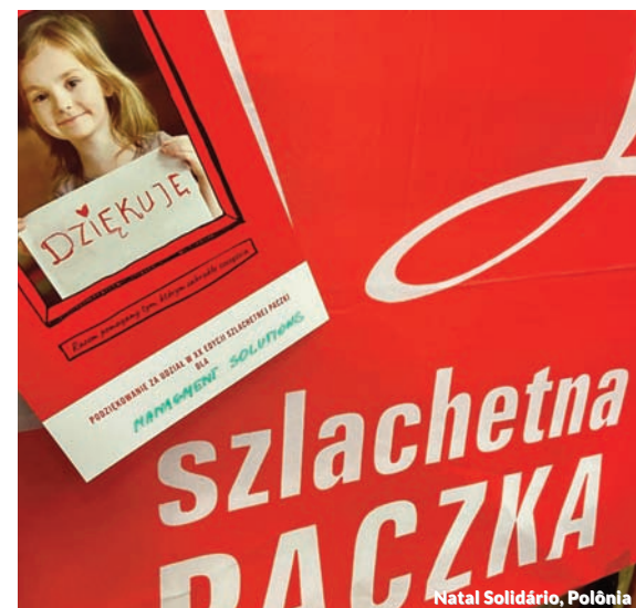
Natal Solidário, Polônia