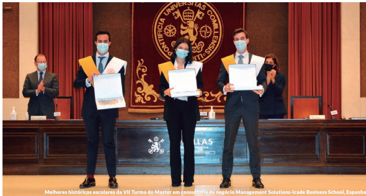
Melhores históricos escolares da VII Turma do Master em consultoria de negócio Management Solutions-Icade Business School, Espanha

A Management Solutions contribui para a transmissão do conhecimento Universidade – Firma, por meio de convênios