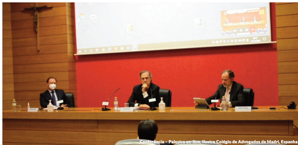
Conferência – Palestra on-line, Ilustre Colégio de Advogados de Madri, Espanha