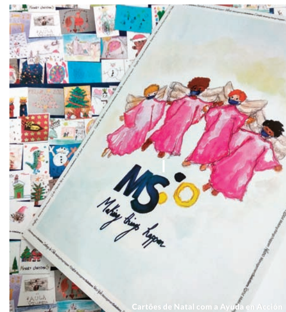
Cartões de Natal com a Ayuda en Acción