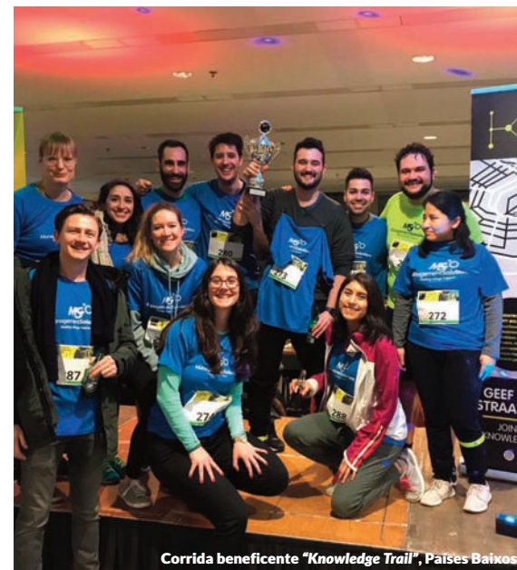
Corrida beneficente “Knowledge Trail”, Países Baixos.

Um grupo de mais de 20 profissionais da Management Solutions Amsterdã participaram da II edição da corrida de solidariedade “Knowledge Trail”, que colabora com a Het Gehandicapte Kinds Foundation. O bom ambiente presidiu a participação dos membros da Management Solutions, que estavam participando pela primeira vez em um evento dessa natureza e, divididos em equipes de 5 pessoas, e que percorreram as principais ruas da cidade, ao mesmo tempo em