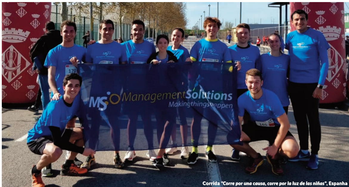
Corrida “Corre por una causa, corre por la luz de las niñas”, Espanha