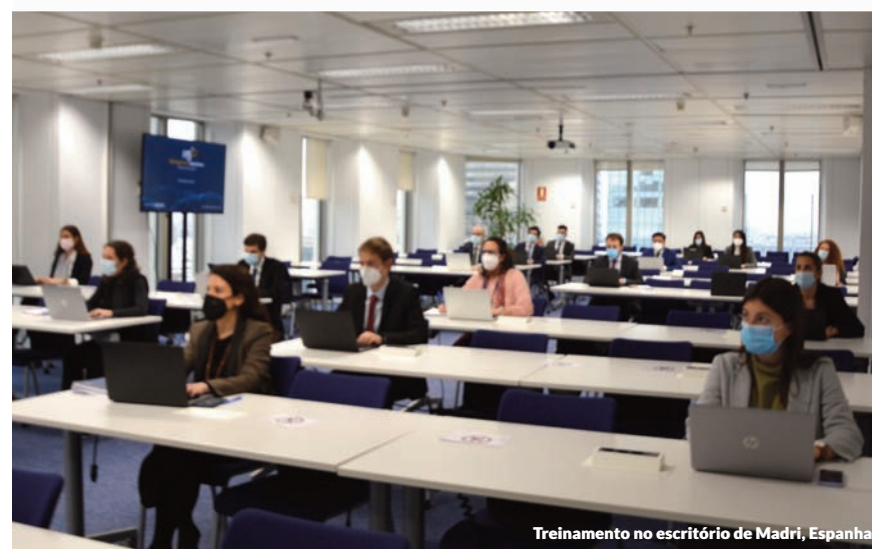
Treinamento no escritório de Madri, Espanha