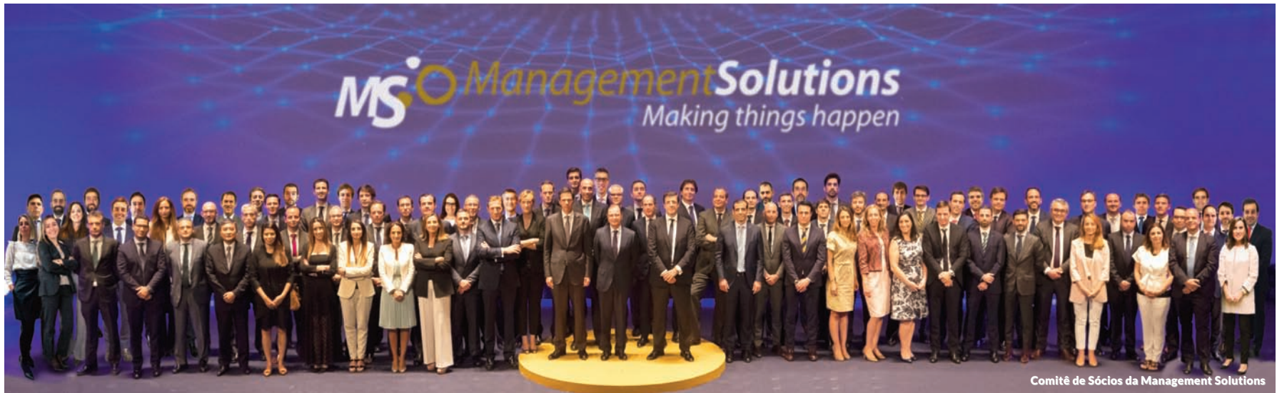
Comitê de Sócios da Management Solutions

longo prazo que assumimos com nossos clientes, profissionais e comunidades nos países em que atuamos.